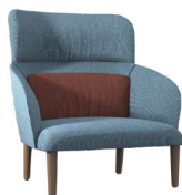
kamal wood design Archirivolto

IT Fusto in legno massello e multistrato; poliuretano espanso ignifugo rivestito in fibra acrilica; rivestimento fisso, cuscino lombare sfoderabile; piedi in rovere naturale o tinto.